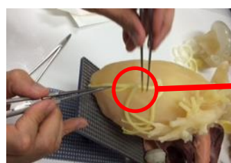
バイパス手術での血管の吻合