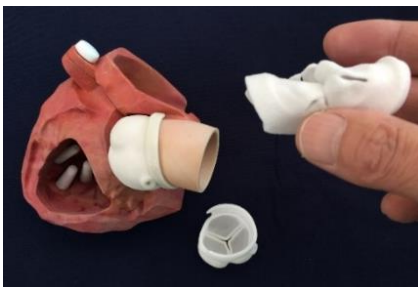
心臓弁モデル (大動脈弁、僧帽弁など) (切開、切除、縫合などに対応している)